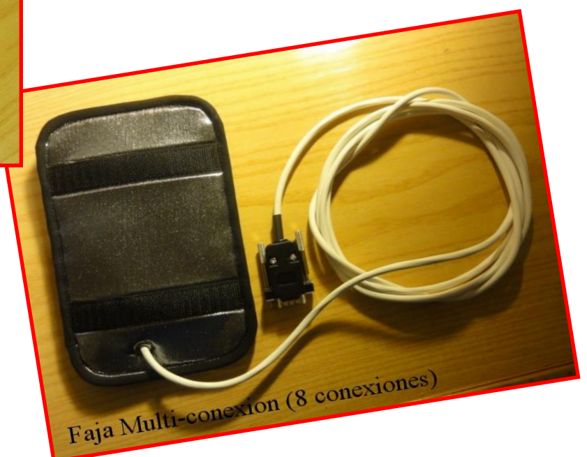
Faja Multi-conexion (8 conexiones)