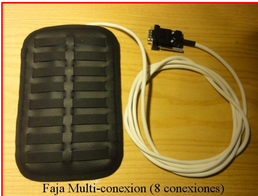
Faja Multi-conexion (8 conexiones)